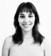
Eva G. Herrero Fotógrafa y Docente