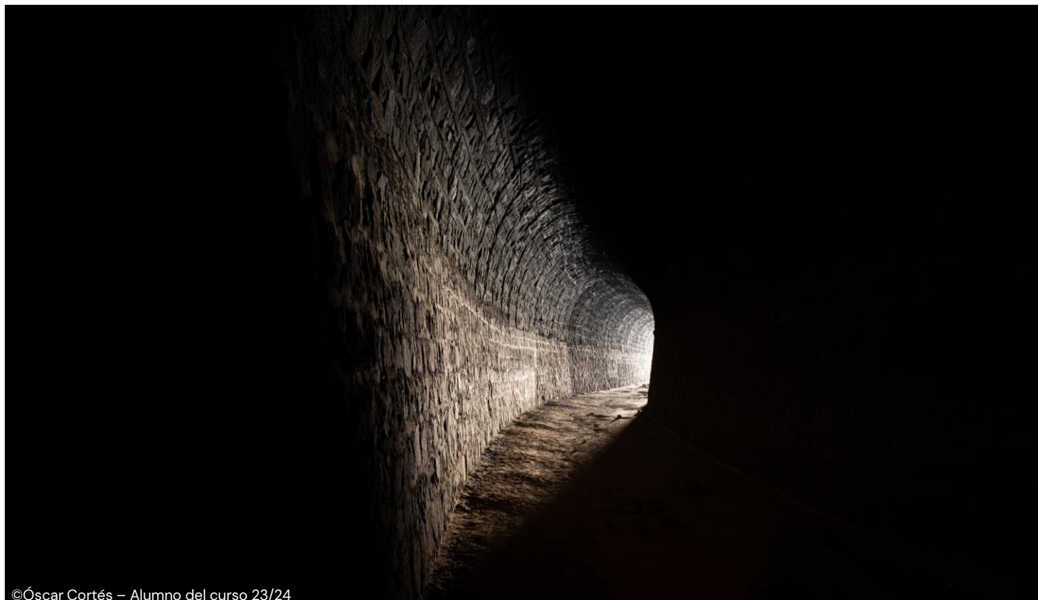
©Óscar Cortés – Alumno del curso 23/24