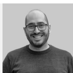
Manuel San Frutos Fotógrafo y editor