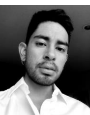
Santiago Neyra Fotógrafo