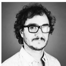
Jorge Salgado Fotógrafo y artista visual