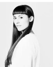
Laura San Segundo Fotógrafa