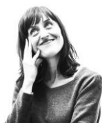
Ana Amado Fotógrafa