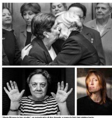
"Foto Picasso in her studio", un autoritratto di Ana Amado, e sopra la foto del celebre bacio

«L'immagine del bacio tra Breznev e Honecker parla di Identità europea in quanto ritrae un momento storico di frantumazione, non così lontano nel tempo, il 1970, rievocando le due Europee separate dalla cortina di ferro, circostanza che si chiude quasi 50 anni dopo con la caduta del muro di Berlino, che rappresenta, quindi, l'inizio di un panorama politico in Europa. In una seconda lettura, l'immagine parla della costruzione dell'identità di genere e mira a provocare una riflessione per contrasto sulla disuguaglianza, e viceversa l'identità. L'impossibilità storica delle donne, e ancor più delle donne anziane, di occupare posti di comando».