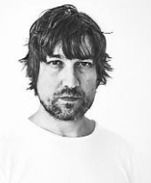
Rafa Trapiello Fotógrafo y Docente