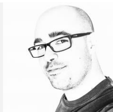
Jacobo Medrano Fotógrafo y Docente