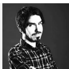
Rodrigo Rivas Fotógrafo y Docente