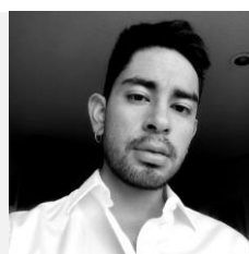
Santiago Neyra Fotógrafo y Docente