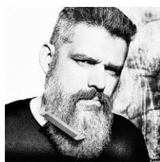
Pollobarba Fotógrafo y Docente