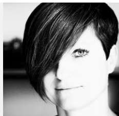
Hanna Jarzabekj Fotógrafa documental