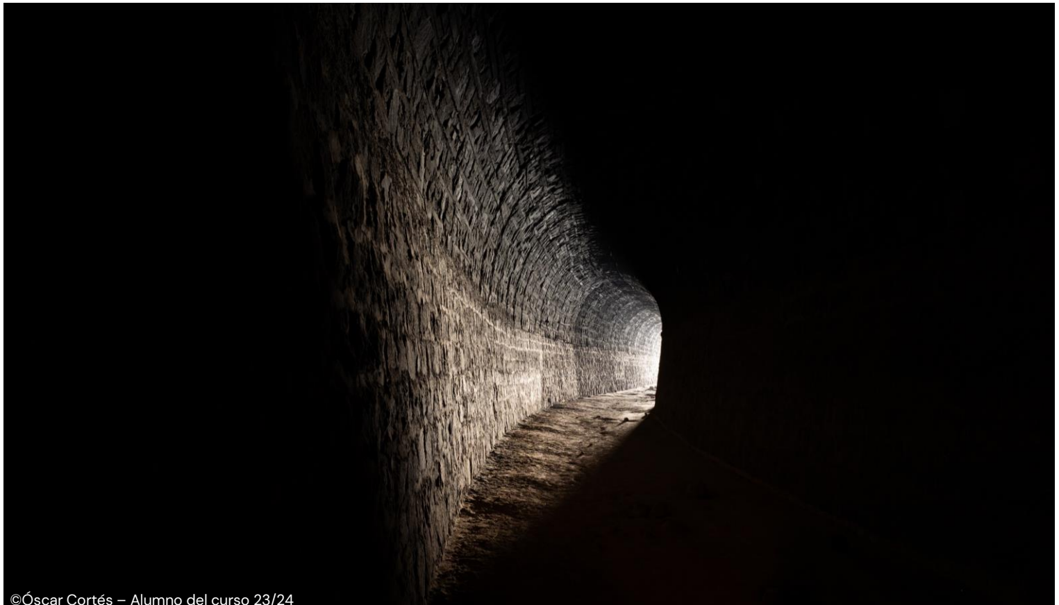
©Óscar Cortés – Alumno del curso 23/24