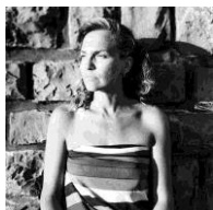
Gloria Oyarzabal Fotógrafa

Como profesor cuenta con 10 años de experiencia docente. Además de impartir numerosos cursos en LENS, es profesor visitante en la Universidad Complutense y en la Universidad de Navarra en España, y en las universidades KABK (La Haya), de Utrecht y St Joost Breda en Holanda.