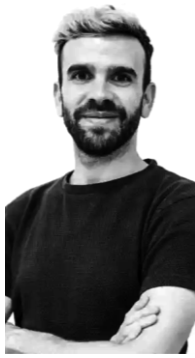
Daniel Mayrit Fotógrafo.

Ganador del premio Aperture Paris Photo al mejor primer libro de fotografía en 2015 por su libro You haven't seen their faces , ha expuesto e impartido conferencias dentro y fuera de España, además de desarrollar tareas de comisariado en diversos festivales.