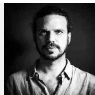
Nicolás Combarro Fotógrafo