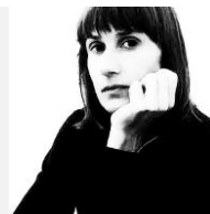
Elisa Gallego Arquitecta y fotógrafa