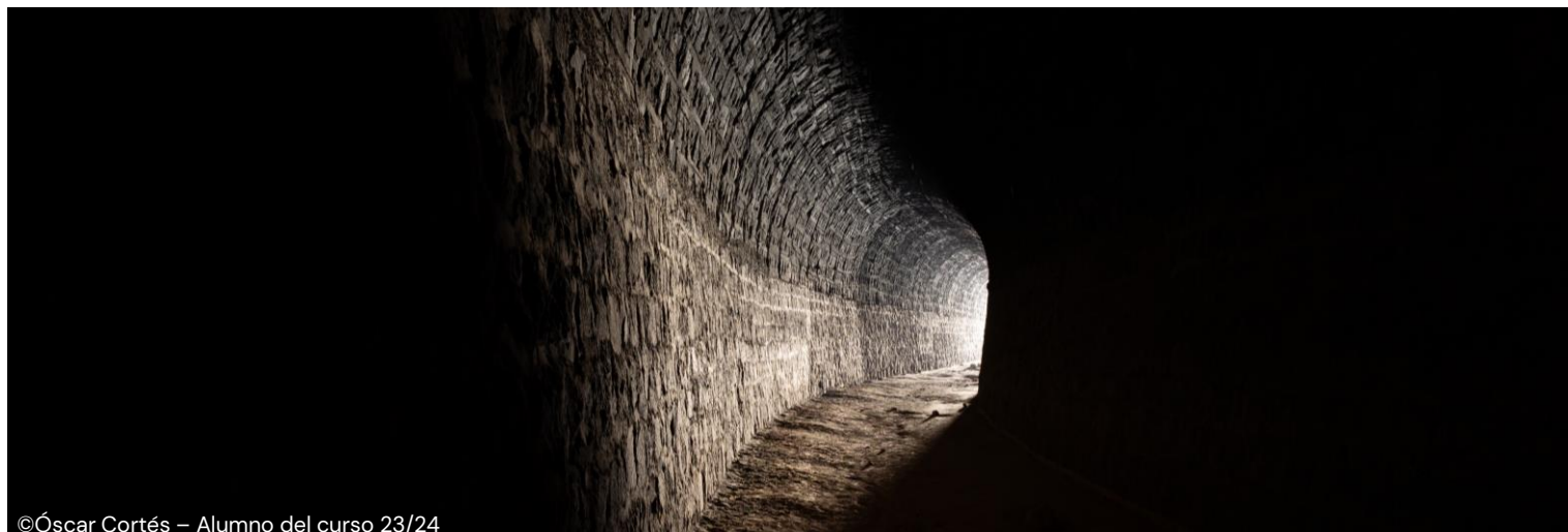
©Óscar Cortés – Alumno del curso 23/24