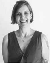
Lúa Fischer Fotógrafa y Docente