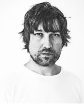
Rafa Trapiello Fotógrafo y Docente