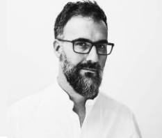
Daniel Merino Fotógrafo y Docente