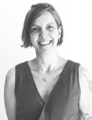
Lúa Fischer Fotógrafa