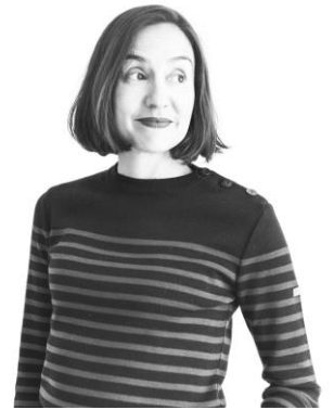
María Platero Fotógrafa