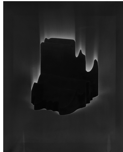
© Federico Clavarino Event Horizon (Message from the Darkroom)

Este curso se plantea como una aplicación práctica de lo aprendido en el curso EDICIÓN FOTOGRÁFICA Y NARRATIVA VISUAL. METODOLOGÍAS, en el que la práctica de la combinatoria fotográfica y la reflexión sobre el