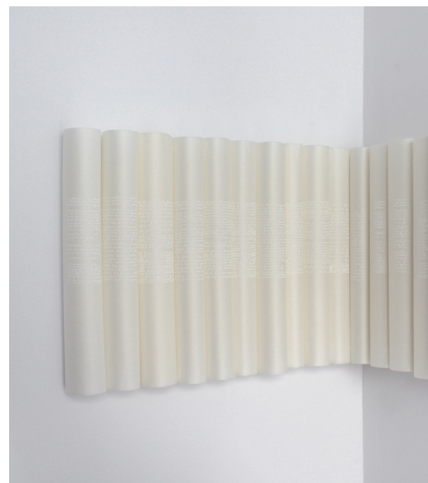
© Shirin Salehi - Gacela 407

Shirin Salehi plantea un curso basado en proceso, reflexión y debate en torno a una selección de casos de estudio para explorar la arquitectura de un libro de artista y desarrollar un trabajo personal durante el curso. Cómo definir las herramientas visuales propicias para cada proyecto, así como pensar las nociones de tono, tempo y ética en el planteamiento conceptual y su materialización, conformarán los ejes principales de la creación de cada libro.