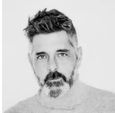
Roberto Amorós Fotógrafo y Docente