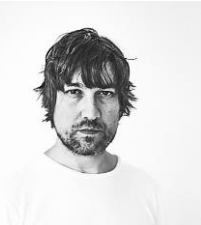
Rafa Trapiello Fotógrafo y Docente