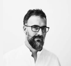
Daniel Merino Fotógrafo y Docente