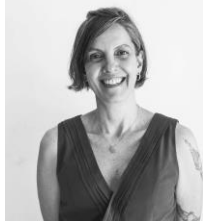
Lúa Fischer Fotógrafa y Docente